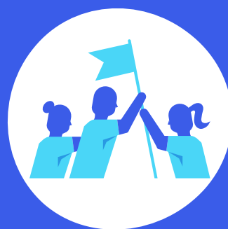
Trabalho em equipe